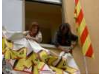
Pancarta generalista, façana primer pis.