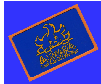
Carnet de soci Al darrera dades família.