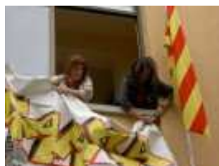
Pancarta generalista, façana primer pis.

Pancarta semestral en color per penjar al carrer, façana edifici. 2 x 1 metres.