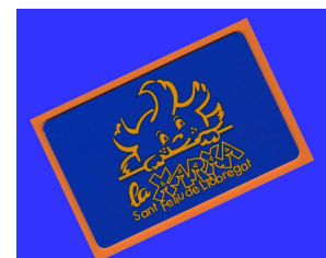
Carnet de soci Al darrera dades família.