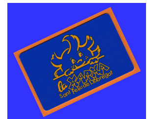
Carnet de soci Al darrera dades família.