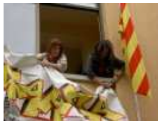
Pancarta generalista, façana primer pis.