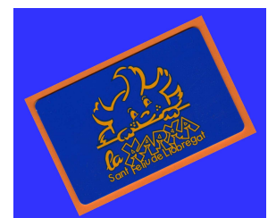
Carnet de soci Al darrera dades família.