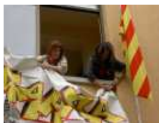
Pancarta generalista, façana primer pis.